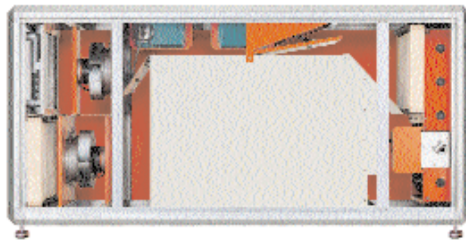
Berendezés háromfokozatú rekuperatív hővisszanyerővel

kiegészítő fűtés nélkül. A berendezés hővisszanyerője 80%-nál magasabb hatásfokkal nyeri vissza a teremből elszívott levegő hőtartalmát. A magas hatásfokú hővisszanyerés és a legmodernebb ventilátor technológia gondoskodik az energiatakarékos üzemről, a DDC automatika pedig a kényelmes kezeléstről.