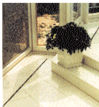
Elegáns levegő bevezetés

A jól működő légvezetési rendszer megvalósulásának feltétele - tekintettel az emberek tartózkodási zónájának huzatmentességére - a levegő terembe való belépésének a helyes kialakítása. A piacon kapható egy speciális, szinte láthatatlan résbefúvó 8 mm-től 12