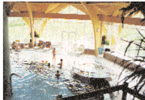
Igényesen kialakított uszodatér

hogy a már korábban említett hőmérséklet- és páratartalom-követelményeket be lehessen tartani. Ezzel a berendezéssel többek között egy megfelelő depressziót kell biztosítani, hogy ne léphessen fel épületszerkezeti károsodás, a határoló helyiségekbe való szag-, illetve páraáramlás.