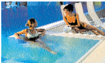
A kellemes közérzet megvalósítható

Az uszoda építőelemeinek károsodását elkerüljük, ha a relatív páratartalom értékét 40\% \leq \varphi \leq 64\% között tartjuk. Rossz épületszerkezet vagy alacsony hőszigetelő képességű üvegezésnél (nagyobb hőveszteség), ha alacsony külső hőmérséklet van, gyakran szükséges a teremlevegőt a határértékek alá szárítani, ami magas