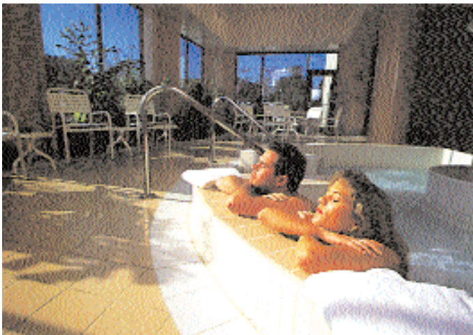
Egyszerűen csak kikapcsolódni

A szabadidejüket, vagy az elvégzett munka utáni időtöltést, egyre többen szeretik kellemes környezetben történő sportolással, kikapcsolódással eltölteni. A jó közérzet megteremtése érdekében az uszoda tervezőjének, építettségének több mindenre előre kell gondolnia.