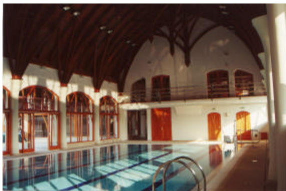
Eger Városi Uszoda, Tanmedence

Az elmúlt 30 év tapasztalatának és fejlesztésének köszönhetően új lehetőségek jelentek meg az uszodaklimatizálás területén. Az üzemeltetők és a megrendelők speciális igényeit maximálisan szemlélve tartva kínálta az elmúlt 10 évben kiforrott ThermoCond 36-os típusú dupla polipropilén lemezes hőcserélővel és hőszivattyúval ellátott berendezést, magas szintű kivitelben (1.kép: Eger Városi Uszoda).